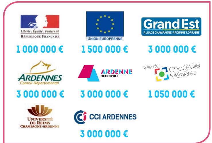
La future Maison des étudiants